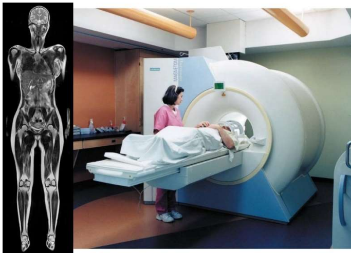
Ganzkörper MRT in Gesundheitsstudien